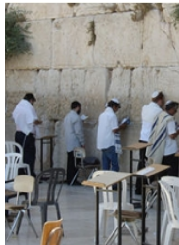
Betende an der Klagemauer in Jerusalem

Eine Anekdote (nach Magaletta & Brawer 1998) illustriert die Intimität, das Gebet für viele Menschen hat: In einem Erstgespräch gab eine 24-jährige Klientin sehr offen über ihre Familiengeschichte, ihr Privatleben und auch über Details ihrer sexuellen Beziehungen Auskunft. Als der Therapeut sie im Verlauf der Anamneseerhebung auch nach der Bedeutung des Gebets in ihrem Leben fragte, zeigte sich die Klientin eher geschockt und rief aus: „Ist das nicht eine sehr persönliche Frage?“ (S. 326)