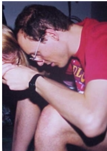
Christliches Fürbittegebet (aus dem Internet): Ein Mann betet mit seiner Frau während der Geburt.